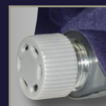
Valve inox résistant au milieu marin