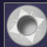
Œillets haute qualité